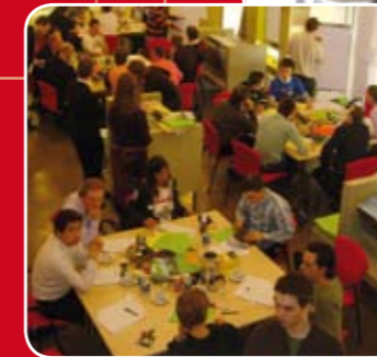
Succesvol experiment: Tijdens INFRATECH bundelen jonge mensen hun innovatieve ideeën in een Creatief Atelier.

De deelnemers noemden het atelier "Enerverend, origineel, vernieuwd" en "Een leuke dag, inspirerend om met zoveel jonge, enthousiaste collega's over je werk te praten. Dit moeten we vaker doen!"